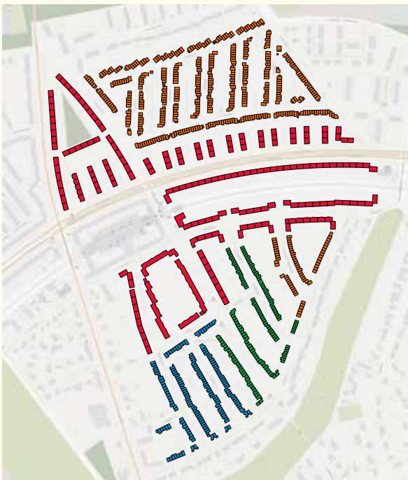
Lageplan Waldsiedlung Berlin-Zehlendorf. Rot: Mehrfamilienhäuser von Bruno Taut 1926–1932, Orange: Einfamilienhäuser von Bruno Taut 1927–1930, Blau: Einfamilienhäuser von Otto Rudolf Salvisberg 1926–1927, Grün: Ein- familienhäuser von Hugo Häring 1926–1927

Wer heute von Architektur-Avantgarde träumt, lässt das Bauen sein, situationsspezifische Partnerschaften beiseite, und aktualisiert die Denk-